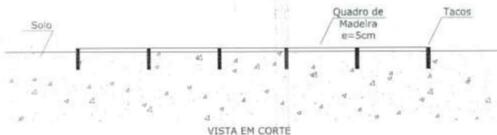
VISTA EM CORTE DETALHE QUADRO DE MADEIRA Fixação no Solo com Tacos

Será executado um quadro de madeira para dar forma ao espaço pavimentado, nas dimensões de 5,0m x 10,0m (ver Figura 2) e com altura de 5,00cm (cinco centímetros) acima do solo, afixado ao solo com tacos de madeira (ver Figura 1) para garantir a firmeza da estrutura.